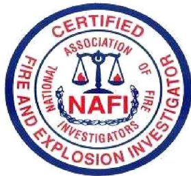
CFEI 자격 패치