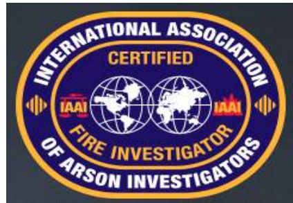
CFI 자격 패치